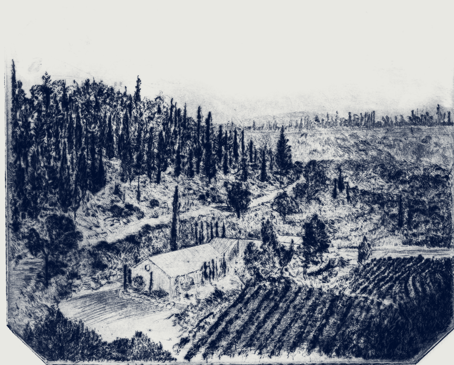
Hakdoshim Forest, Judean Hills